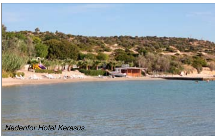
Nedenfor Hotel Kerasus