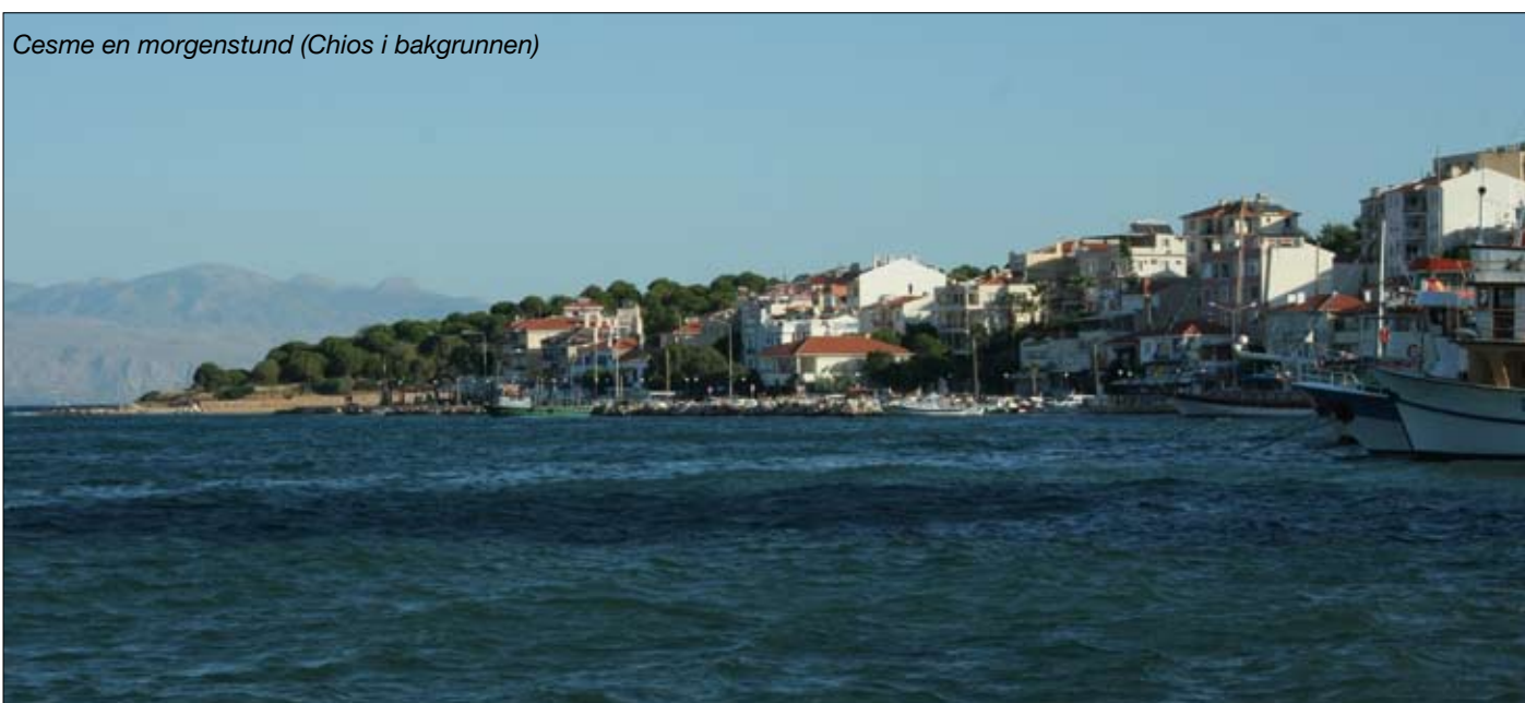
Cesme en morgenstund (Chios i bakgrunnen)

Klima. – Viktig er det å få med seg at klimaet her i Nordtyrkia er bedre enn på sydkysten, der det ofte kan bli alt for varmt og adskillig varmere enn her i den nordlige delen av landet.